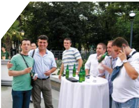
Gosti i zaposleni u Carlsberg Srbija bili su gosti na svečanoj večeri