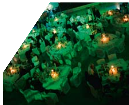
ISO/TC 176 konferencija