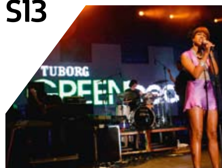
Tuborg Green Beat