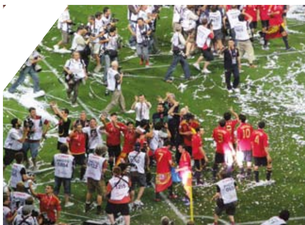
Trenutak kada su fudbaleri Španije proslavljali titulu evropskog prvaka