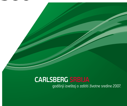
Godišnji izveštaj o zaštiti životne sredine