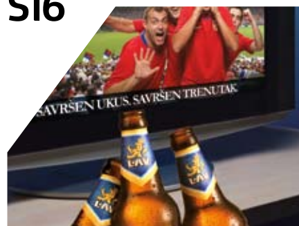
Lav sponzor Fudbalske reprezentacije Srbije

Besplatan časopis za kupce kompanije Carlsberg Srbija d.o.o. CS: BUSINESS