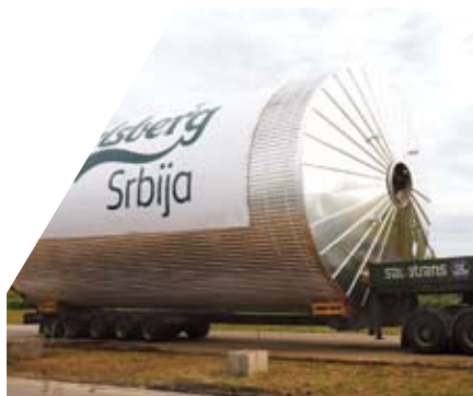
Carlsberg Srbija proširila kapacitete