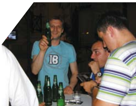
Dobro se jelo i pilo i u samom UEFA selu, koje je bilo smešteno tik uz fudbalski stadion u kome je Carlsberg imao svoje "mesto pod nebom"